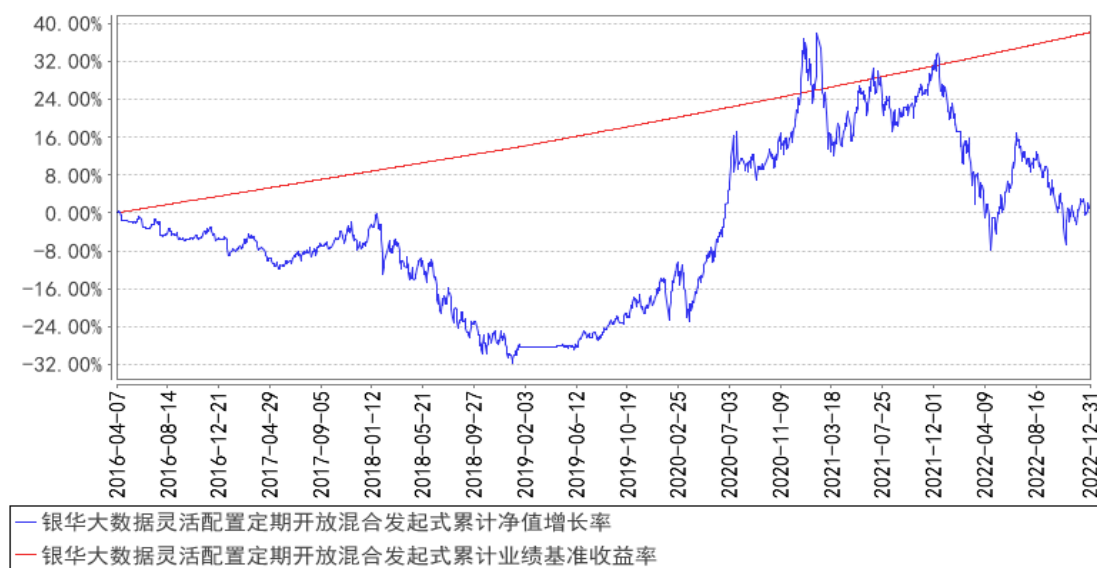
银华大数据灵活配置定期开放混合发起式累计净值增长率与同期业绩比较基准收益率的历史走势对比图

注：按基金合同的规定，本基金自基金合同生效起六个月内为建仓期，建仓期结束时本基金的各项投资比例已达到基金合同的规定：在开放期内股票投资比例为基金资产的 0%-95%，在封闭期内股票投资比例为基金资产的 0%-100%；权证投资比例为基金资产净值的 0%-3%；开放期内的每个交易日日终，在扣除股指期货合约需缴纳的交易保证金后，应当保持不低于基金资产净值 5%的现金或到期日在一年以内的政府债券。在封闭期内，本基金不受上述 5%的限制，但每个交易日日终在扣除股指期货合约需缴纳的交易保证金后，应当保持不低于交易保证金一倍的现金。其中，现金不包括结算备付金、存出保证金、应收申购款等。