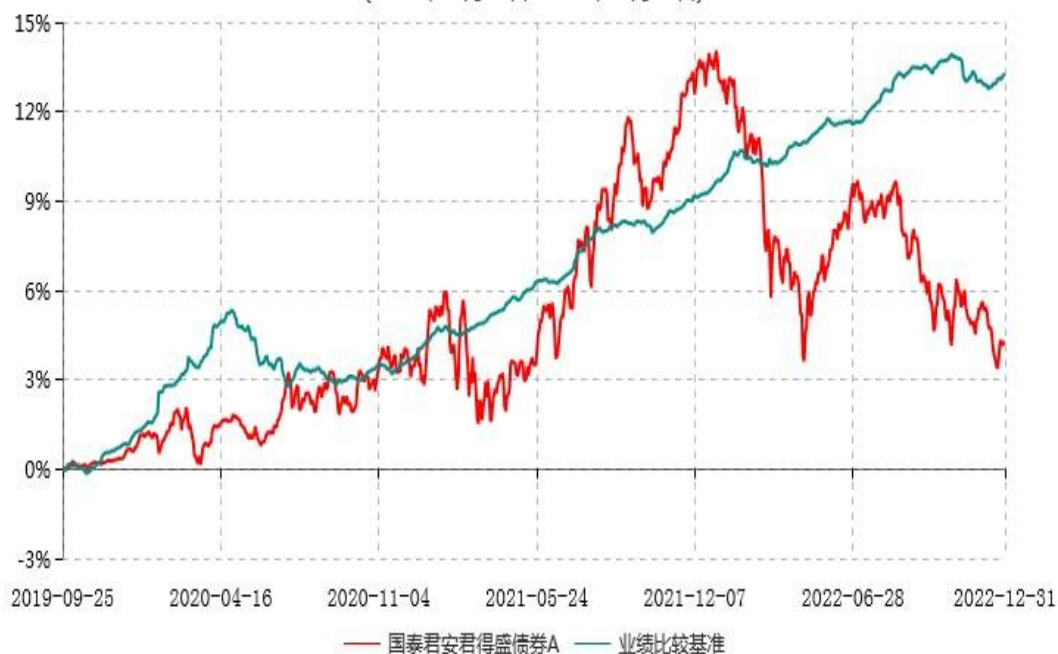
国泰君安君得盛债券A累计净值增长率与业绩比较基准收益率历史走势对比图 (2019年09月25日-2022年12月31日)