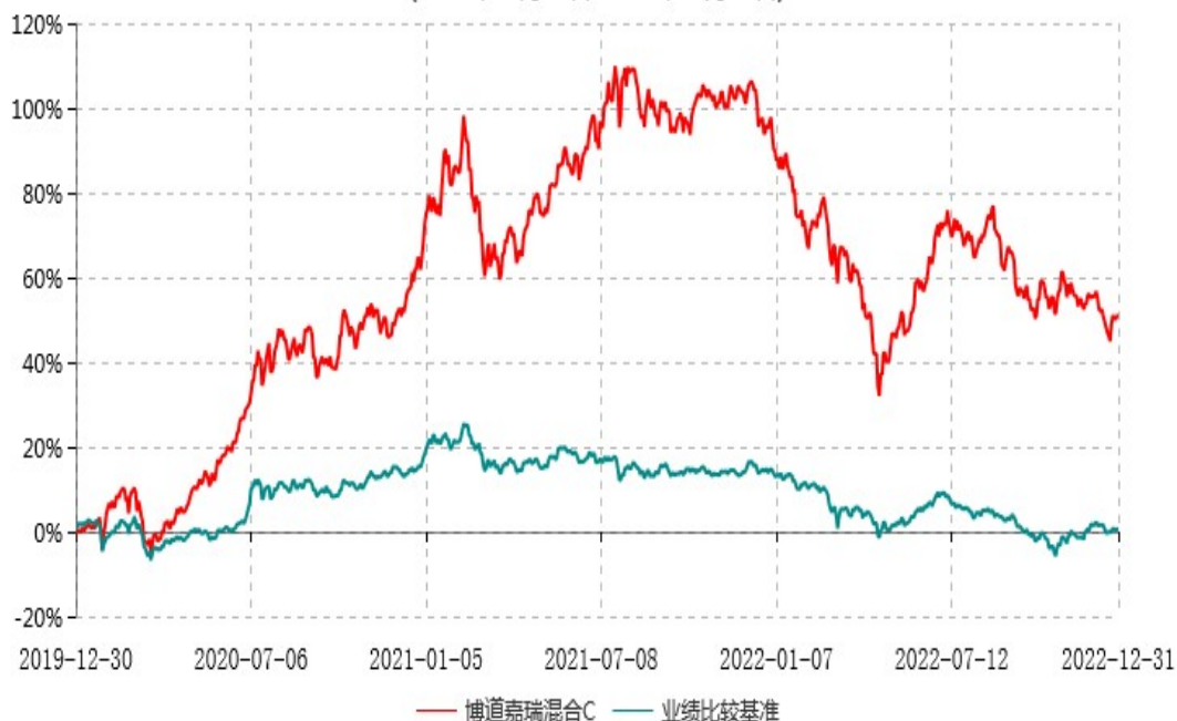
博道嘉瑞混合C累计净值增长率与业绩比较基准收益率历史走势对比图 (2019年12月30日-2022年12月31日)

注：本基金建仓期为自基金合同生效日起的6个月。截至建仓期结束，本基金各项资产配置比例符合基金合同及招募说明书有关投资比例的约定。