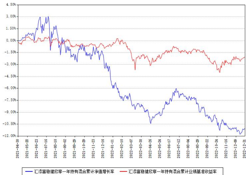
汇添富稳健欣享一年持有混合累计净值增长率与同期业绩基准收益率对比图

注：本基金建仓期为本《基金合同》生效之日（2021年04月30日）起6个月，建仓期结束时各项资产配置比例符合合同约定。