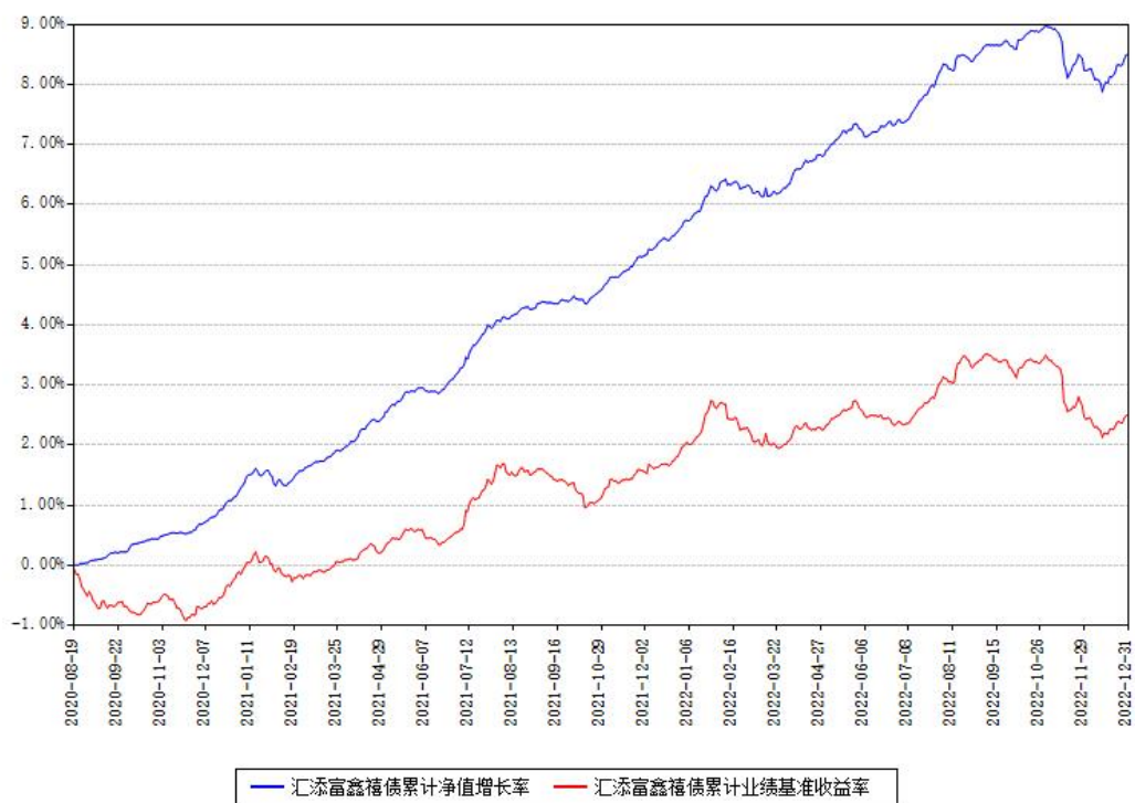
汇添富鑫禧债累计净值增长率与同期业绩基准收益率对比图

注：本基金建仓期为本《基金合同》生效之日（2020年08月19日）起6个月，建仓期结束时各项资产配置比例符合合同约定。