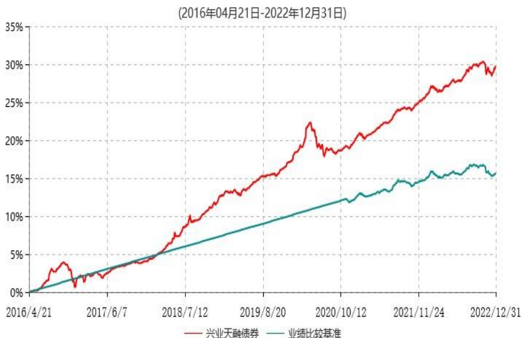
兴业天融债券型证券投资基金累计净值增长率与业绩比较基准收益率历史走势对比图

注：本基金的业绩比较基准自2020年11月4日起变更为：中国债券综合全价指数收益率。