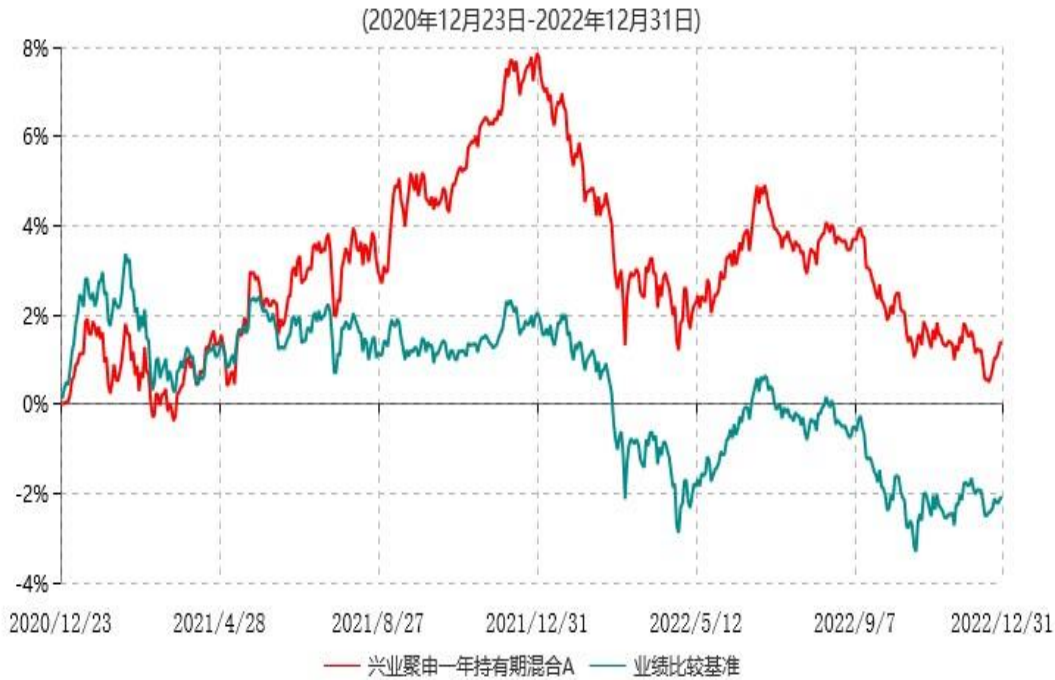
兴业聚申一年持有期混合A累计净值增长率与业绩比较基准收益率历史走势对比图

注：本基金基金合同于2020年12月23日生效，根据本基金基金合同规定，基金管理人自基金合同生效之日起6个月内已使基金的投资组合比例符合基金合同的有关约定。