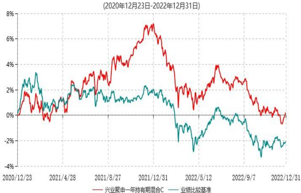
兴业聚申一年持有期混合C累计净值增长率与业绩比较基准收益率历史走势对比图

注：本基金基金合同于2020年12月23日生效，根据本基金基金合同规定，基金管理人自基金合同生效之日起6个月内已使基金的投资组合比例符合基金合同的有关约定。