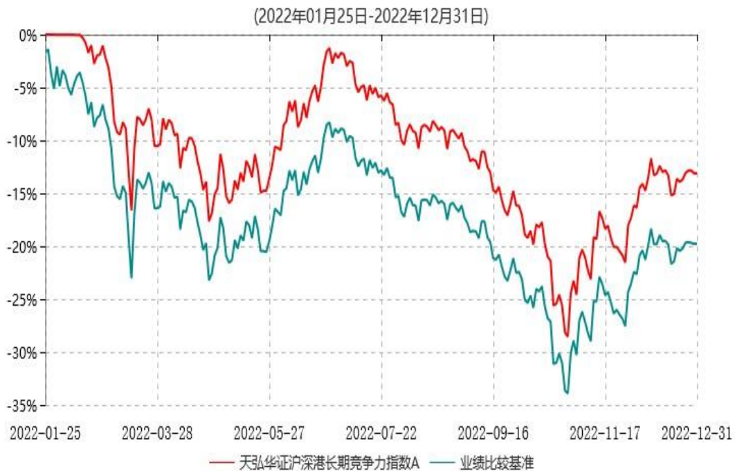
天弘华证沪深港长期竞争力指数A累计净值增长率与业绩比较基准收益率历史走势对比图