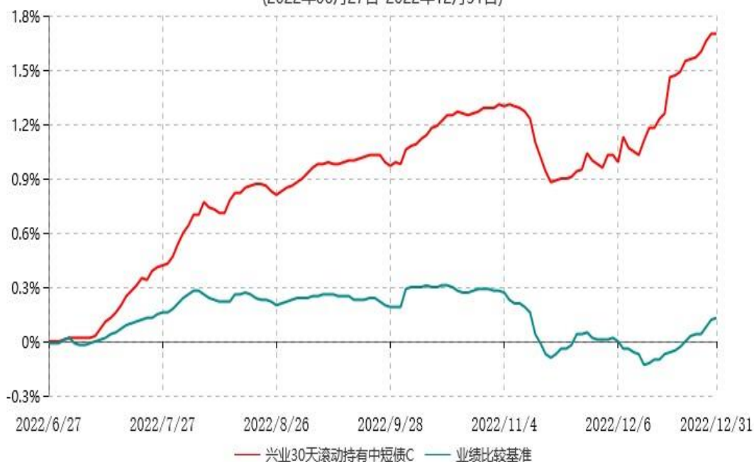
兴业30天滚动持有中短债C累计净值增长率与业绩比较基准收益率历史走势对比图 (2022年06月27日-2022年12月31日)