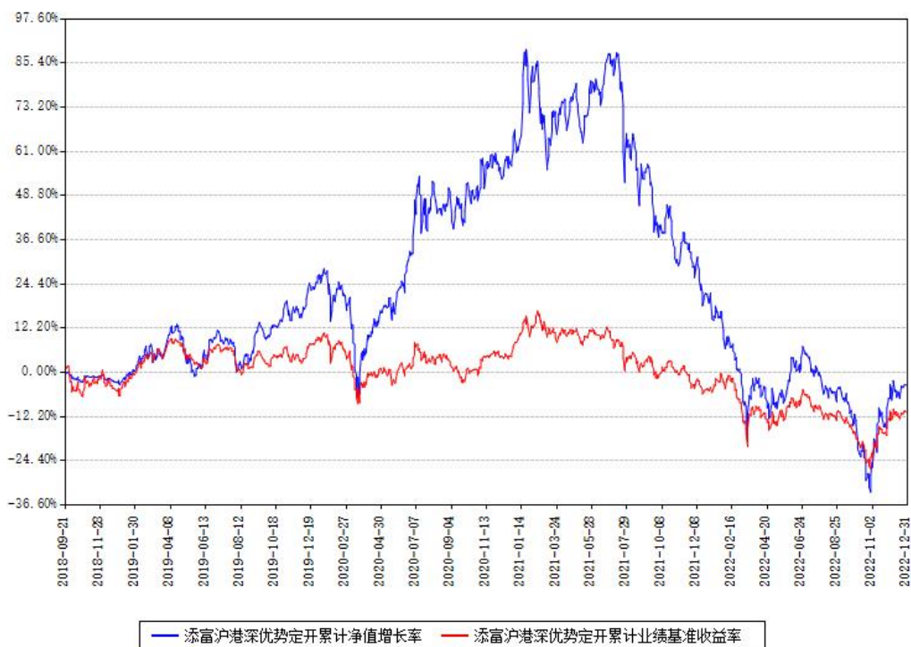
添富沪港深优势定开累计净值增长率与同期业绩基准收益率对比图

注：本基金建仓期为本《基金合同》生效之日（2018年09月21日）起6个月，建仓期结束时各项资产配置比例符合合同约定。