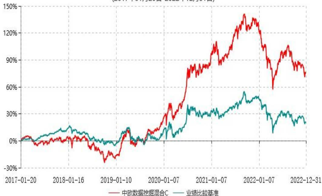
中欧数据挖掘混合C累计净值增长率与业绩比较基准收益率历史走势对比图 (2017年01月20日-2022年12月31日)

注：2019年4月26日组合业绩比较基准变更为中证500指数收益率*95%+中债综合指数收益率*5%。自2017年1月19日起本基金增加C类份额，图示日期为2017年1月20日至2022年12月31日。