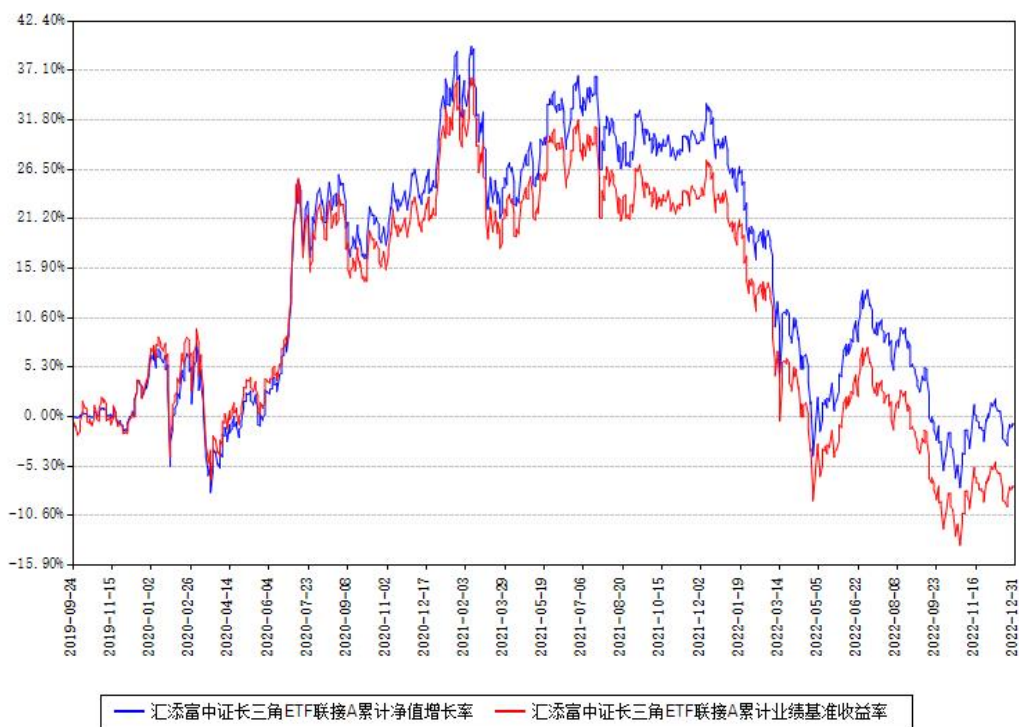
汇添富中证长三角ETF联接A累计净值增长率与同期业绩比较基准收益率对比图