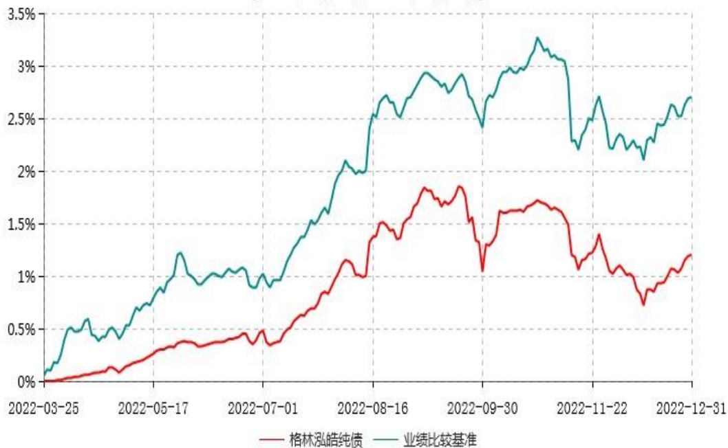
格林泓皓纯债债券型证券投资基金累计净值增长率与业绩比较基准收益率历史走势对比图 (2022年03月25日-2022年12月31日)