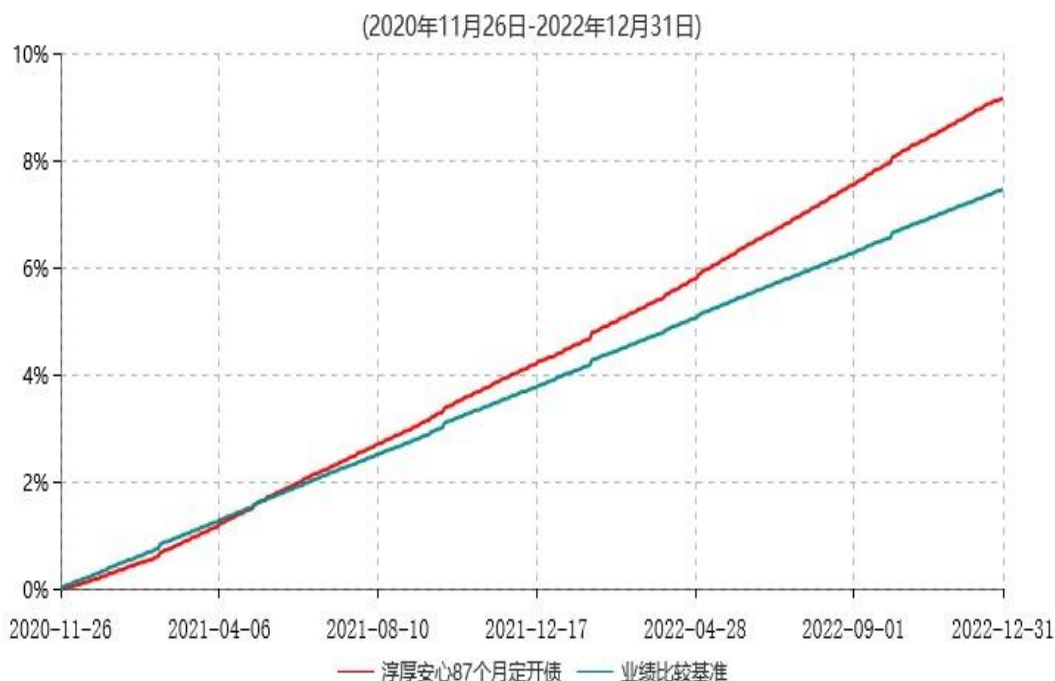
淳厚安心87个月定期开放债券型证券投资基金累计净值增长率与业绩比较基准收益率历史走势对比图

注：本基金基金合同生效日为2020年11月26日。按基金合同规定，本基金自基金合同生效起6个月内为建仓期。建仓期结束时本基金的各项投资比例均符合基金合同约定。