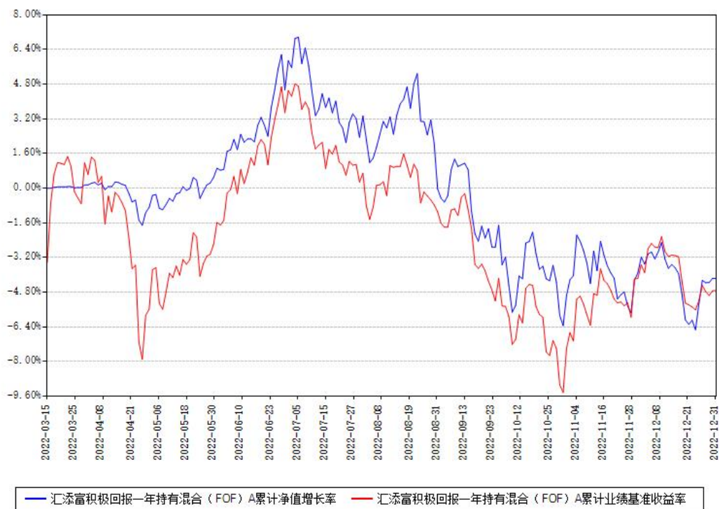
汇添富积极回报一年持有混合（FOF）A累计净值增长率与同期业绩比较基准收益率对比图