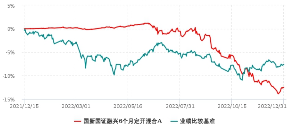
国新国证融兴6个月定开混合C累计净值增长率与业绩比较基准收益率历史走势对比图