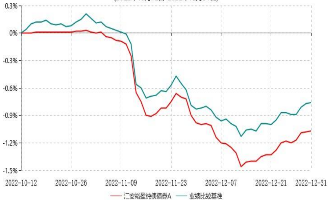
汇安裕盈纯债债券A累计净值增长率与业绩比较基准收益率历史走势对比图 (2022年10月12日-2022年12月31日)