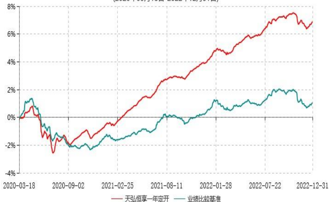
天弘恒享一年定期开放债券型发起式证券投资基金累计净值增长率与业绩比较基准收益率历史走势对比图 (2020年03月18日-2022年12月31日)