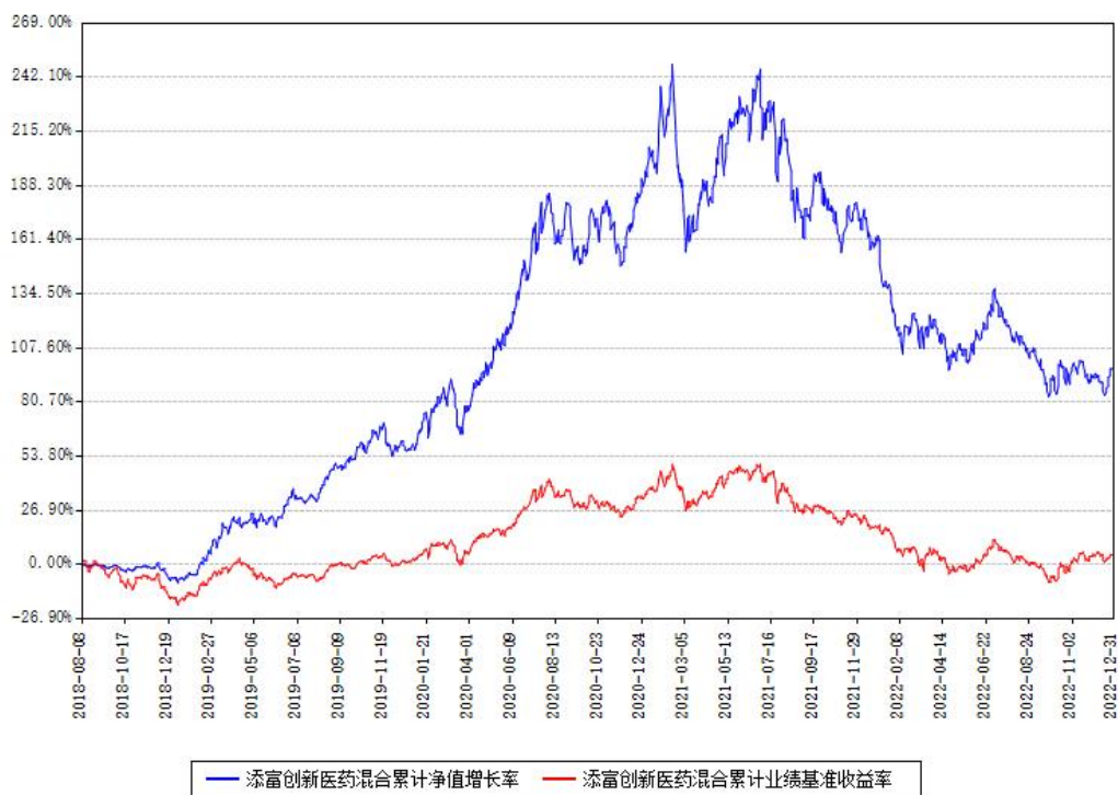
添富创新医药混合累计净值增长率与同期业绩基准收益率对比图

注：本基金建仓期为本《基金合同》生效之日（2018年08月08日）起6个月，建仓期结束时各项资产配置比例符合合同约定。