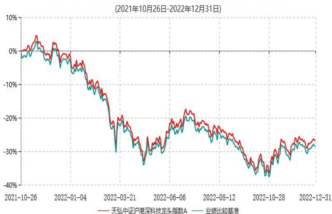
天弘中证沪港深科技龙头指数A累计净值增长率与业绩比较基准收益率历史走势对比图