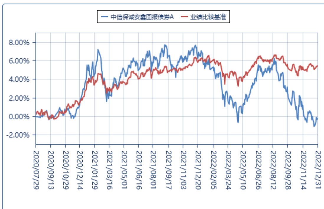
中信保诚安鑫回报债券 C