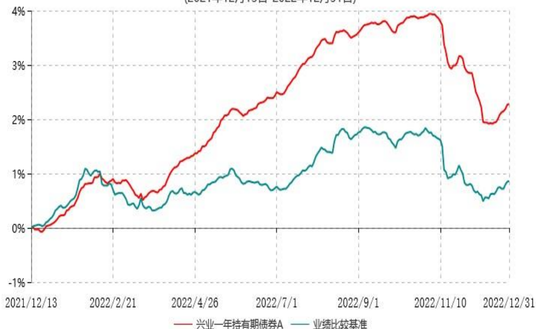
兴业一年持有期债券A累计净值增长率与业绩比较基准收益率历史走势对比图 (2021年12月13日-2022年12月31日)

本基金合同自2021年12月13日起生效，根据本基金合同规定，本基金自基金合同生效之日起6个月内已使基金的投资组合比例符合基金合同的有关约定。