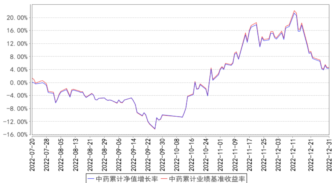
中药累计净值增长率与同期业绩比较基准收益率的历史走势对比图

注：本基金合同生效日期为 2022 年 07 月 20 日，自基金合同生效日起到本报告期末不满一年，按基金合同的规定，本基金自基金合同生效起六个月为建仓期，建仓期结束时各项资产配置比例应当符合基金合同约定。