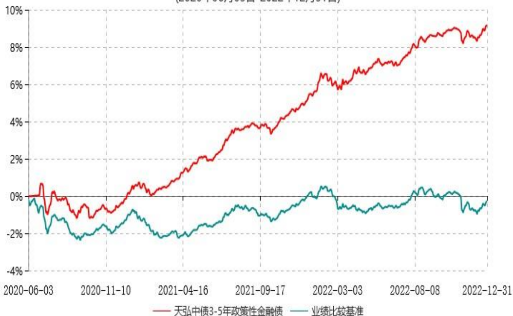
天弘中债3-5年政策性金融债指数发起式证券投资基金累计净值增长率与业绩比较基准收益率历史走势对比图 (2020年06月03日-2022年12月31日)