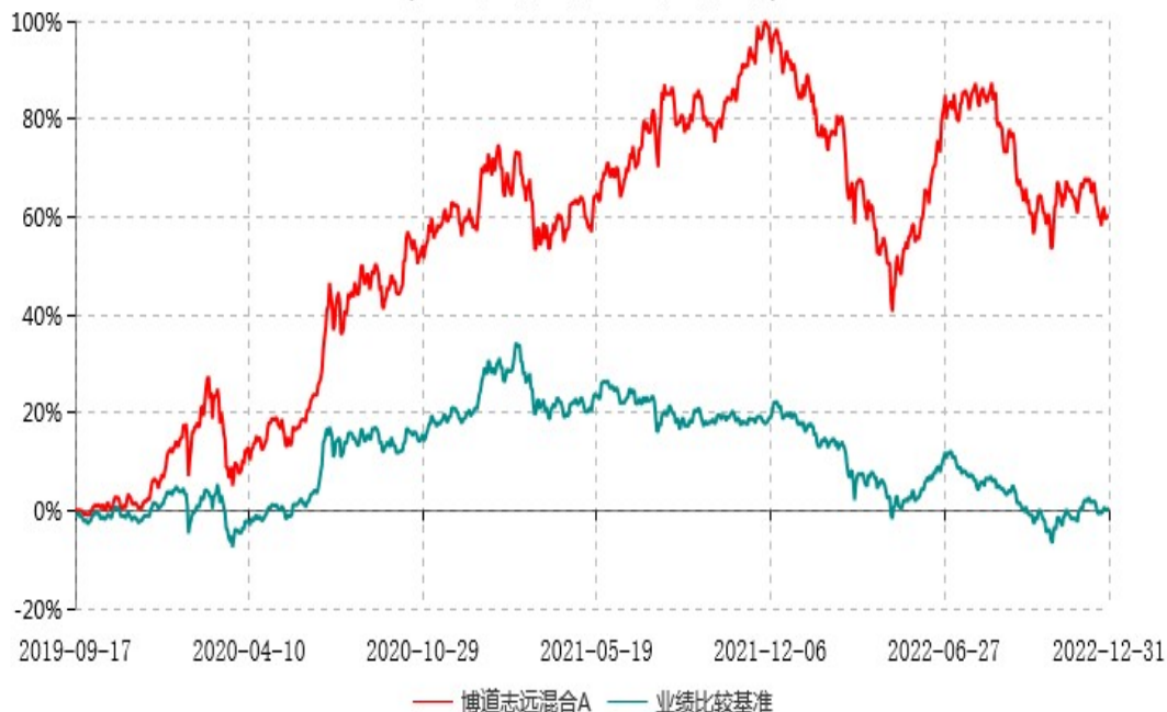
博道志远混合A累计净值增长率与业绩比较基准收益率历史走势对比图 (2019年09月17日-2022年12月31日)

注：本基金建仓期为自基金合同生效日起的6个月。截至建仓期结束，本基金各项资产配置比例符合基金合同及招募说明书有关投资比例的约定。