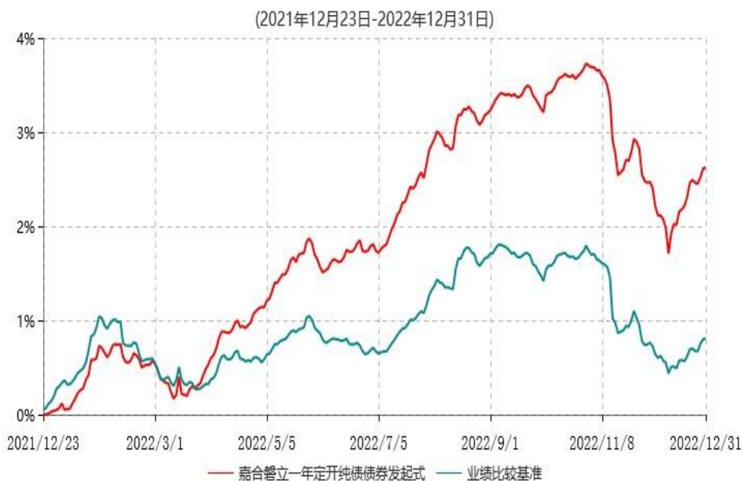
嘉合磐立一年定期开放纯债债券型发起式证券投资基金累计净值增长率与业绩比较基准收益率历史走势对比图

注：本基金合同于2021年12月23日生效。按基金合同规定，本基金自合同生效起6个月内为建仓期。建仓期结束时，本基金的各项资产配置比例符合基金合同约定。