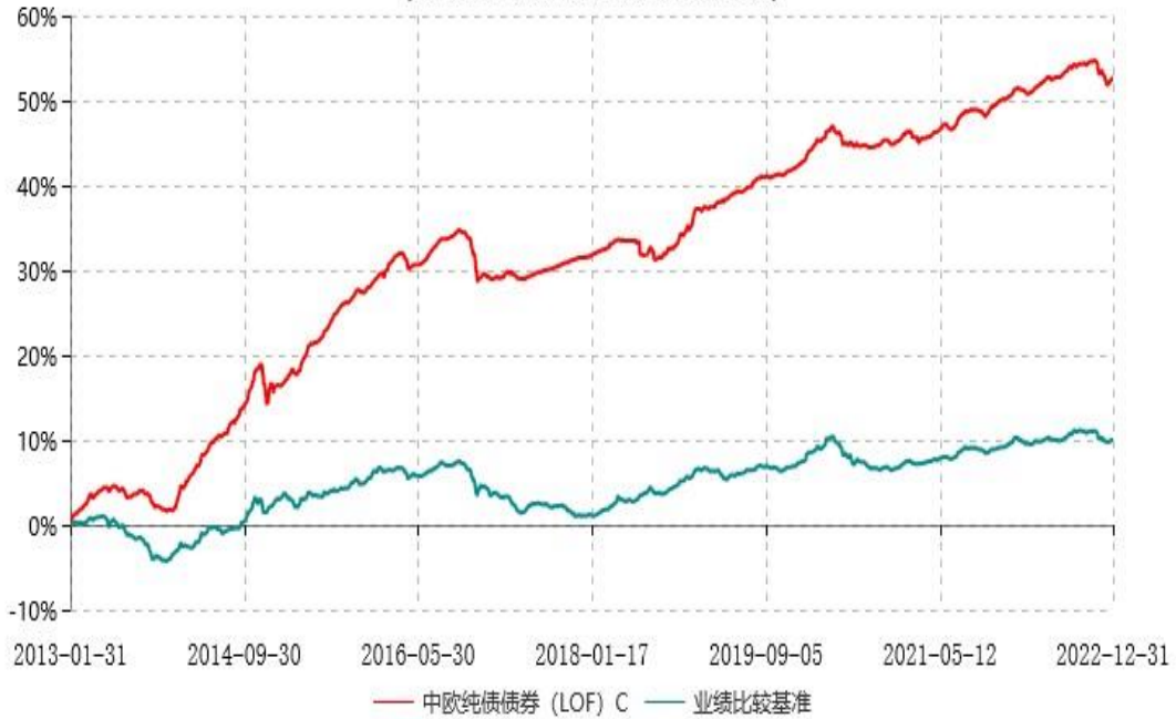
中欧纯债债券 (LOF) C 累计净值增长率与业绩比较基准收益率历史走势对比图 (2013年01月31日-2022年12月31日)