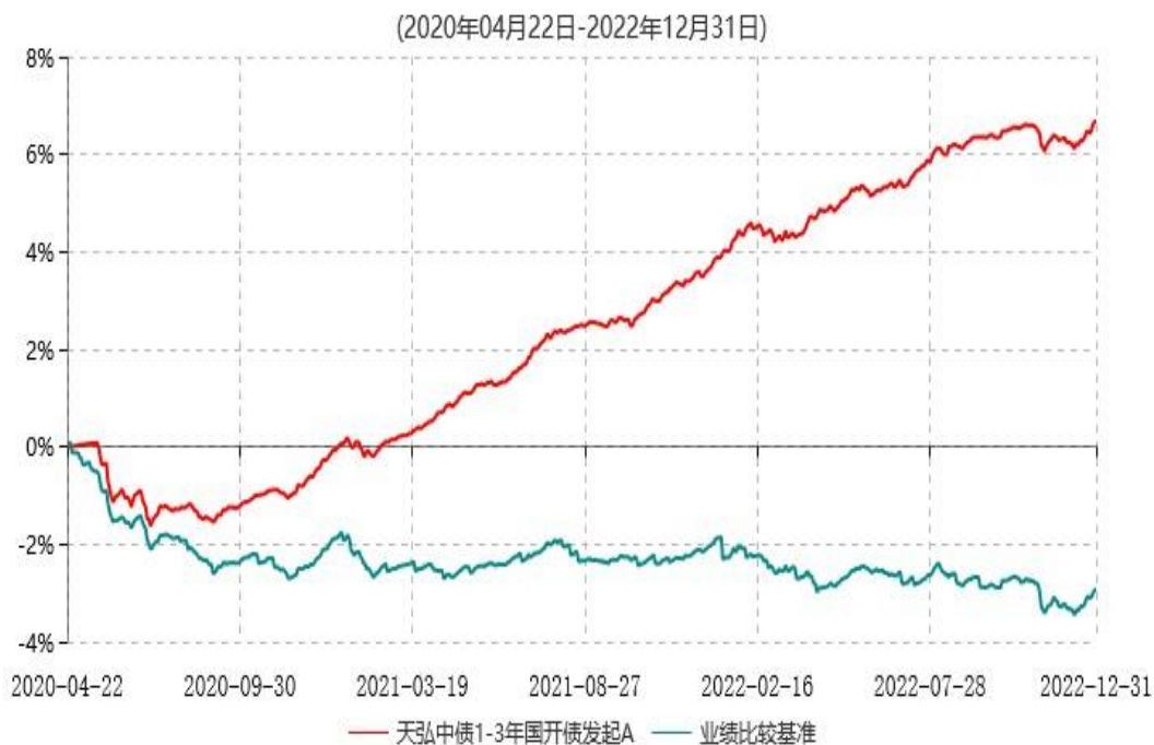
天弘中债1-3年国开债发起A累计净值增长率与业绩比较基准收益率历史走势对比图