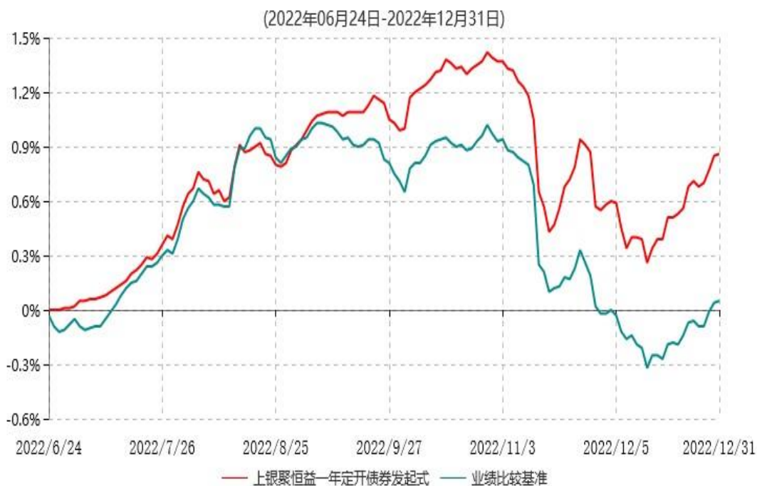
上银聚恒益一年定期开放债券型发起式证券投资基金累计净值增长率与业绩比较基准收益率历史走势对比图

注：本基金合同生效日为2022年6月24日，自基金合同生效日起6个月内为建仓期，建仓期结束时各项资产配置比例符合基金合同约定；截至本报告期末，基金合同生效不满一年。