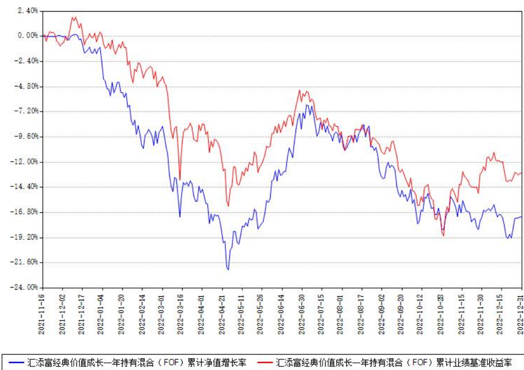
汇添富经典价值成长一年持有混合（FOF）累计净值增长率与同期业绩基准收益率对比图

注：本基金建仓期为本《基金合同》生效之日（2021年11月16日）起6个月，建仓期结束时各项资产配置比例符合合同约定。