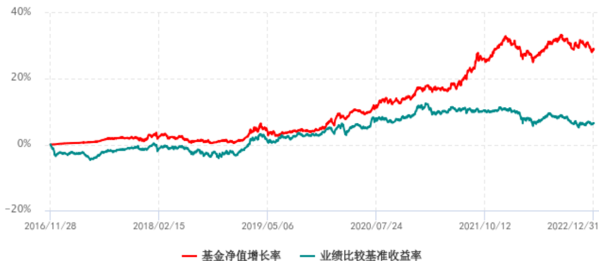
基金份额累计净值增长率与同期业绩比较基准收益率历史走势对比图 (2016年11月28日-2022年12月31日)

注：1. 本基金成立于 2016 年 11 月 28 日；2. 本基金的业绩比较基准为：中债综合全价（总值）指数收益率*80%+沪深 300 指数收益率*20%。