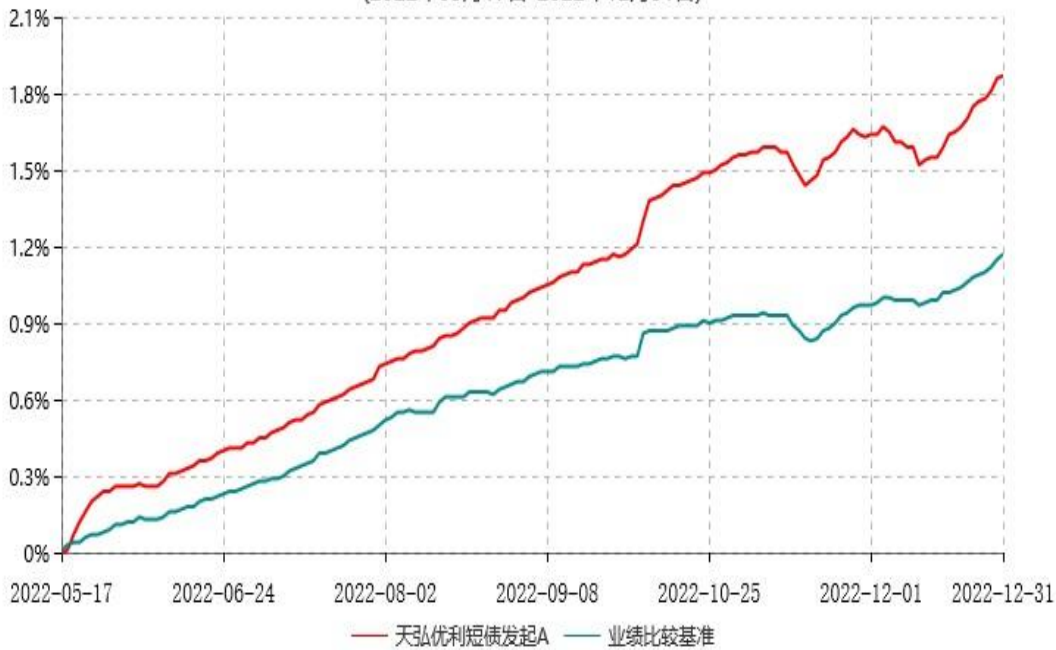
天弘优利短债发起A累计净值增长率与业绩比较基准收益率历史走势对比图 (2022年05月17日-2022年12月31日)