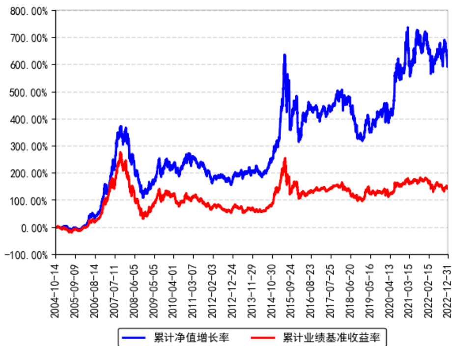
南方积极配置混合（LOF）累计净值增长率与同期业绩比较基准收益率的历史走势对比图