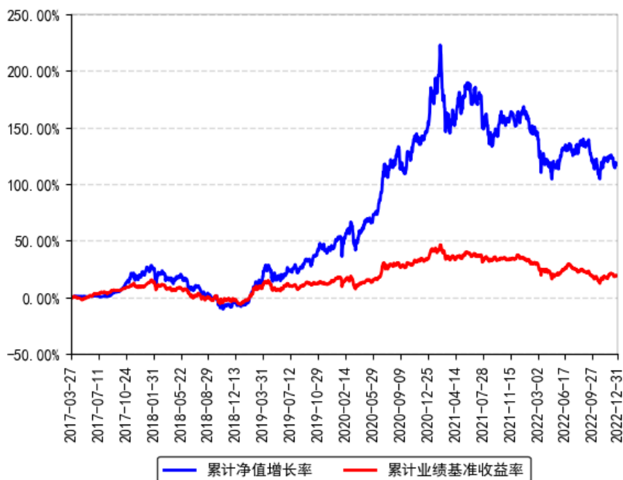
南方智慧精选灵活配置混合累计净值增长率与同期业绩比较基准收益率的历史走势对比图