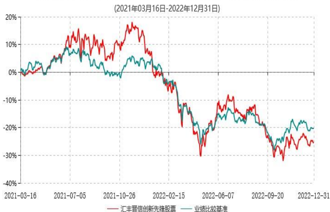
汇丰晋信创新先锋股票型证券投资基金累计净值增长率与业绩比较基准收益率历史走势对比图