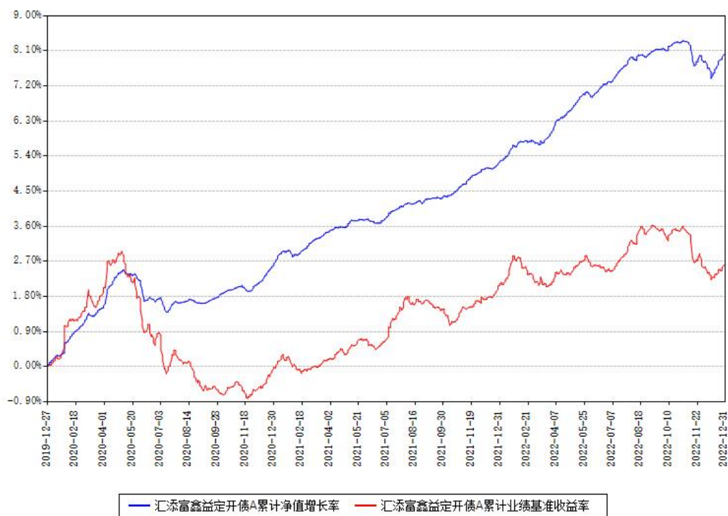
汇添富鑫益定开债A累计净值增长率与同期业绩基准收益率对比图