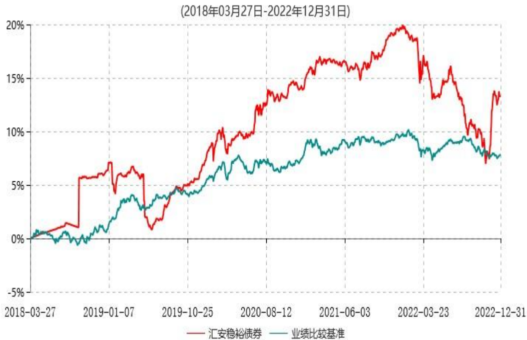
汇安稳裕债券型证券投资基金累计净值增长率与业绩比较基准收益率历史走势对比图