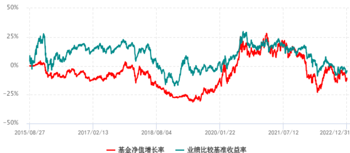
基金份额累计净值增长率与同期业绩比较基准收益率历史走势对比图 (2015年08月27日-2022年12月31日)

注：1、本基金成立于 2015 年 8 月 27 日； 2、比较基准=中证健康产业指数收益率（H30344）*80%+中证综合债指数收益率（H11009）*20%