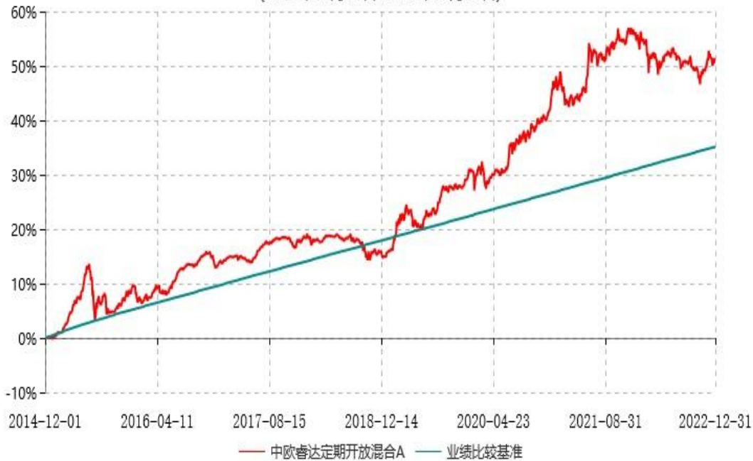
中欧睿达定期开放混合A累计净值增长率与业绩比较基准收益率历史走势对比图 (2014年12月01日-2022年12月31日)