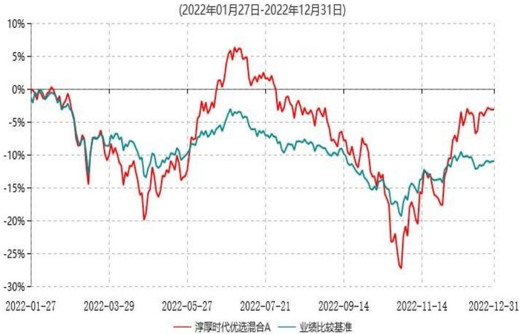
淳厚时代优选混合A累计净值增长率与业绩比较基准收益率历史走势对比图

注：本基金基金合同生效日为2022年1月27日，至报告期末未满1年。按基金合同规定，本基金自基金合同生效起6个月内为建仓期。建仓期结束时本基金的各项投资比例均符合基金合同约定。