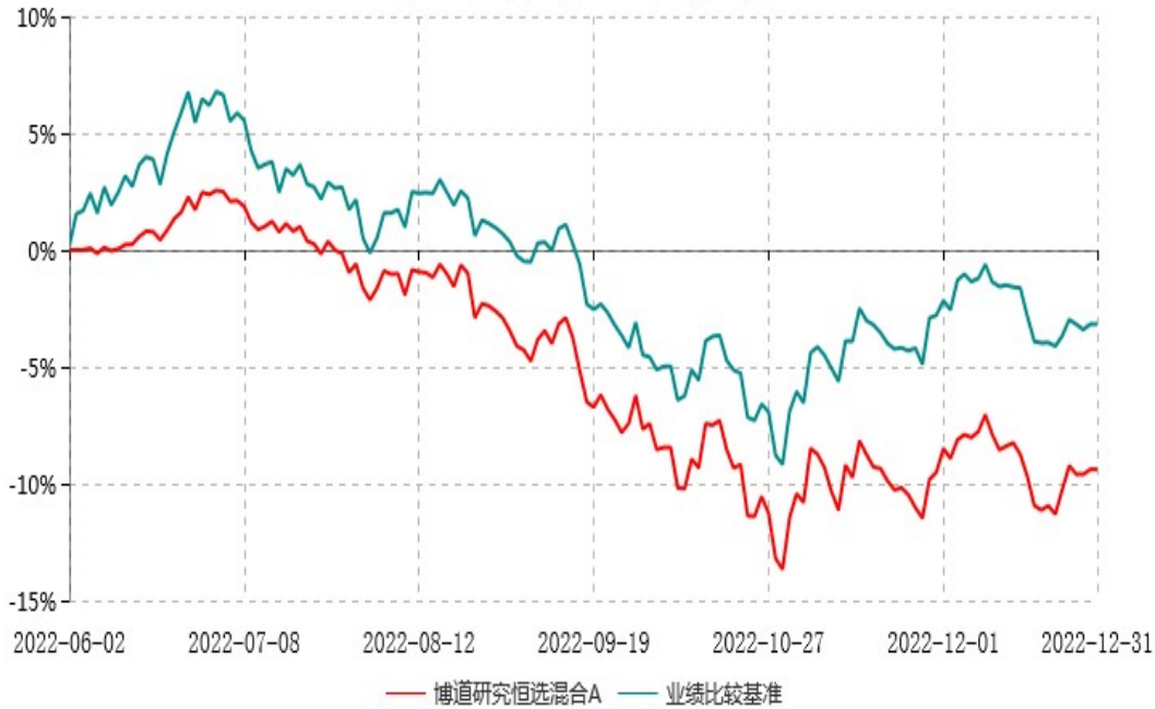
博道研究恒选混合A累计净值增长率与业绩比较基准收益率历史走势对比图 (2022年06月02日-2022年12月31日)

注：本基金基金合同生效日为2022年6月2日，建仓期为自基金合同生效日起的6个月。基金合同生效日至报告期期末，本基金运作时间未及一年。截至建仓期结束，本基金各项资产配置比例符合基金合同及招募说明书有关投资比例的约定。