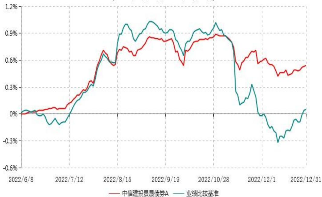
中信建投景晟债券A累计净值增长率与业绩比较基准收益率历史走势对比图 (2022年06月08日-2022年12月31日)