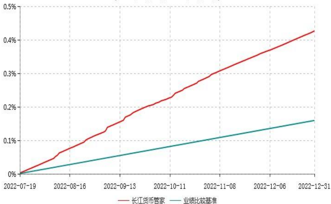
长江货币管家货币市场基金累计净值收益率与业绩比较基准收益率历史走势对比图 (2022年07月19日-2022年12月31日)

注：（1）本基金基金合同生效日为2022年7月19日，截至本报告期末未满一年；（2）按照本基金的基金合同约定，基金管理人应自基金合同生效日起6个月内使基金的投资组合比例符合本基金基金合同第十二部分“二、投资范围”、“四、投资限制”的有关约定。（3）截至本报告期末，本基金尚处在建仓期。