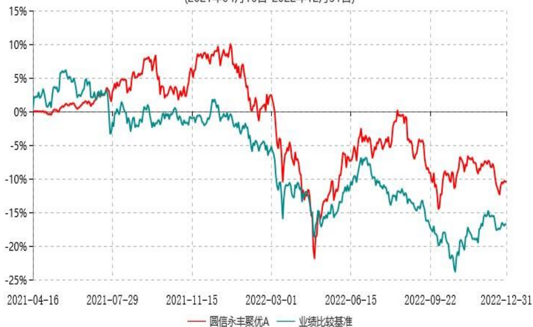
圆信永丰聚优C累计净值增长率与业绩比较基准收益率历史走势对比图