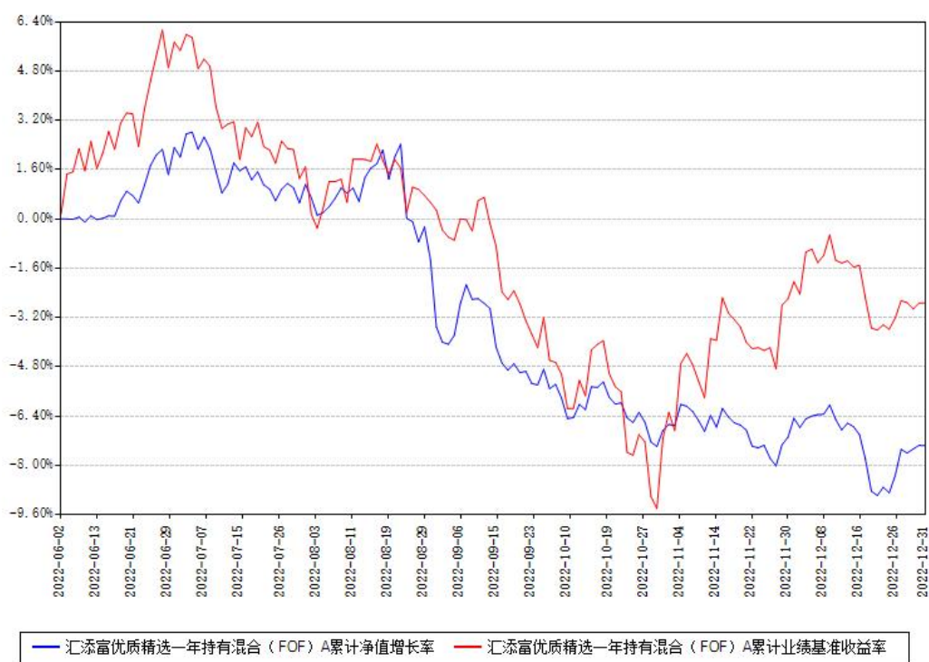
汇添富优质精选一年持有混合（FOF）A累计净值增长率与同期业绩比较基准收益率对比图