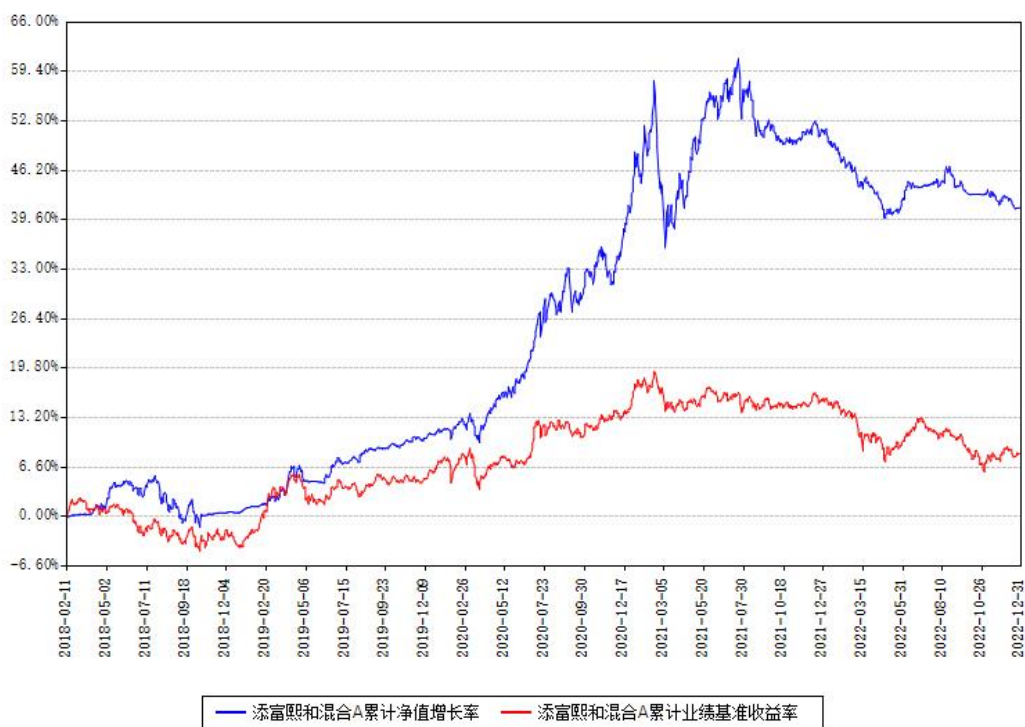
添富熙和混合A累计净值增长率与同期业绩基准收益率对比图