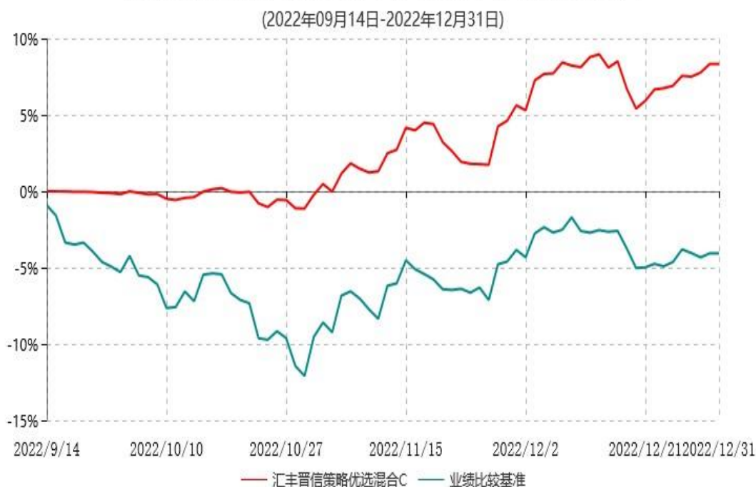
汇丰晋信策略优选混合C累计净值增长率与业绩比较基准收益率历史走势对比图