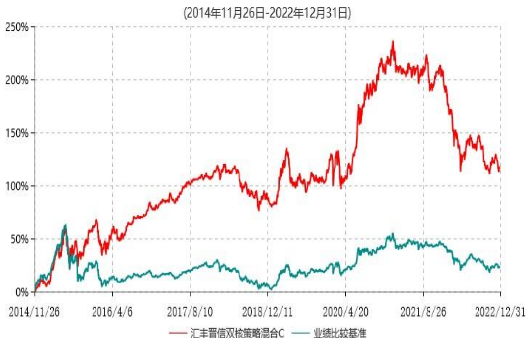
汇丰晋信双核策略混合C累计净值增长率与业绩比较基准收益率历史走势对比图

同期业绩比较基准收益率的计算未包含中证800指数成份股在报告期产生的股票红利收益。本基金业绩比较基准中的中债新综合指数为中债新综合全价(总值)指数，是以债券全价计算的指数值，债券付息后利息不再计入指数之中。