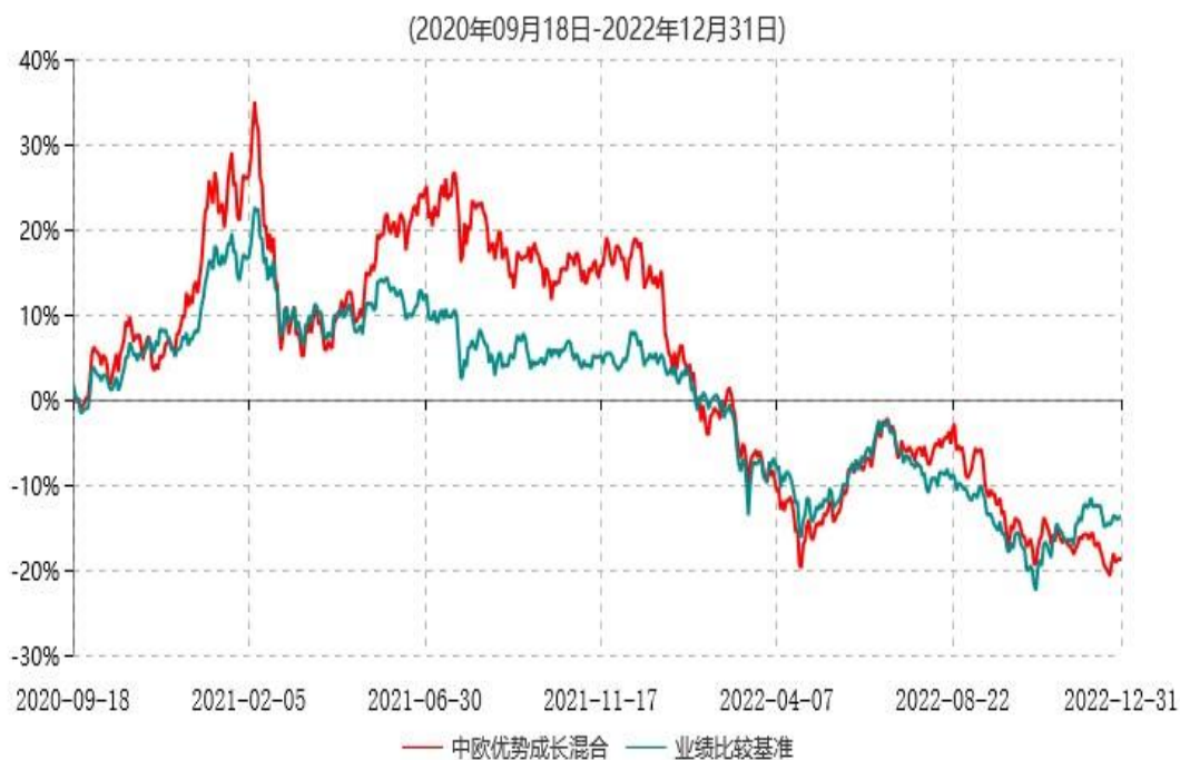
中欧优势成长三个月定期开放混合型发起式证券投资基金累计净值增长率与业绩比较基准收益率历史走势对比图