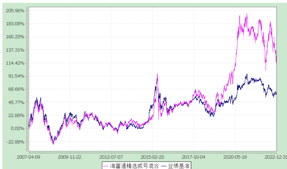
海富通精选贰号混合型证券投资基金 份额累计净值增长率与业绩比较基准收益率的历史走势对比图 (2007年4月9日至2022年12月31日)

注：按基金合同规定,本基金自基金合同生效起 6 个月内为建仓期,建仓期满至今本基金的各项投资比例已达到基金合同有关投资范围的规定,即股票投资 50%-80%,债券投资 20%-50%,权证投资 0-3%;并保持不低于基金资产净值 5%的现金或者到期日在一年以内的政府债券。同时满足第 14 章(七)有关投资组合限制的各项比例要求。